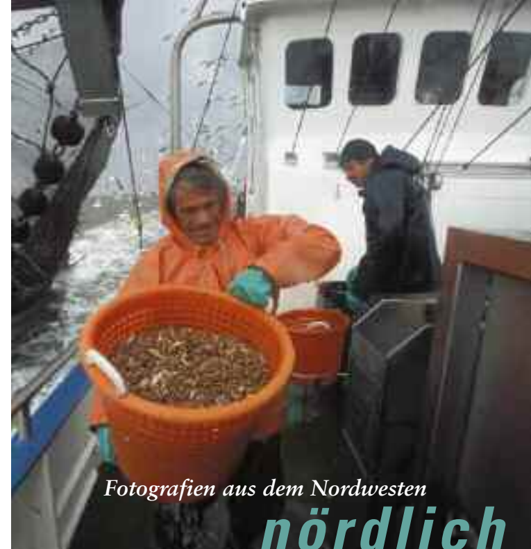
Fotografien aus dem Nordwesten

Am Turbinenhaus 10–12, 27749 Delmenhorst Telefon 042 21/298 58-20 Fax 042 21/298 58-15 www.delmenhorst.de/nordwolle/museen/ E-Mail: info@museen.delmenhorst.de Öffnungszeiten: Di bis Fr und So 10–17 Uhr Mo und Sa geschlossen